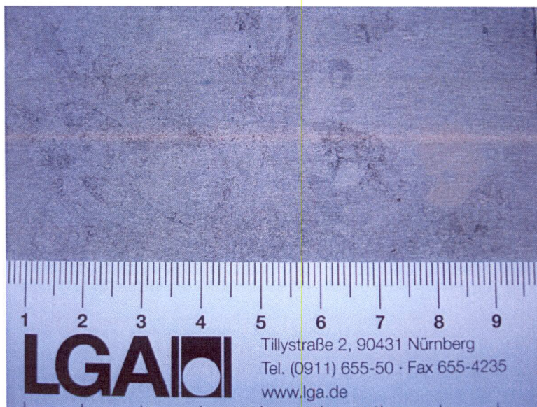
Abb1: Probenstück mit Blick auf gesägte Oberfläche

Das dunkelgraugrüne bis bläuliche Gestein ist makroskopisch als dichter Sandstein mit kalkiger Bindung und organogenen Resten (z.B. Muschelschalen) zu bezeichnen. Die Korngrößen liegt im mm-cm Bereich. Eine mit bloßem Auge sichtbare Porosität ist nicht vorhanden. In der eingelieferten Probe ist eine Schichtung der Bestandteile sichtbar. Verwitterungs- oder Korrosionserscheinungen sind nicht zu erkennen.